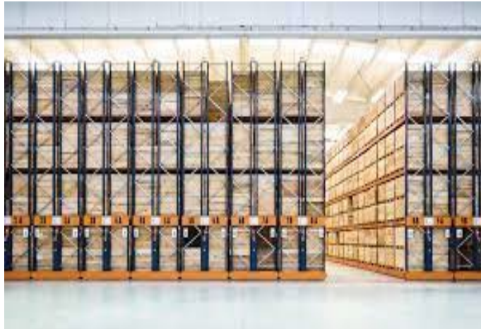
Figure 6: Mobile Pallet Racking /Rajah 6: Rak Palet Mudah Alih