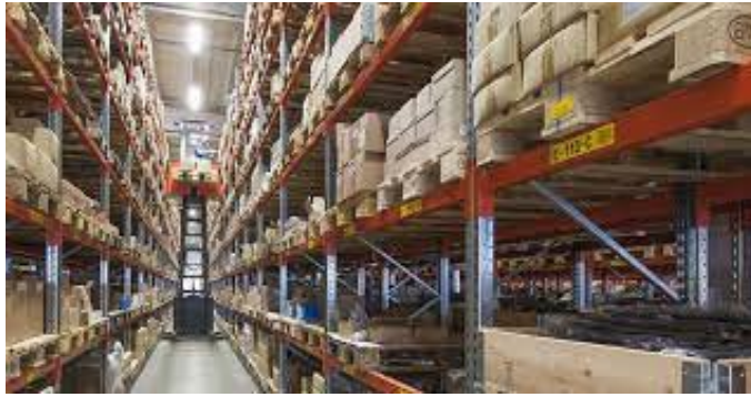
Figure 3: Narrow Aisle Racking /Rajah 3: Rak Lorong Sempit