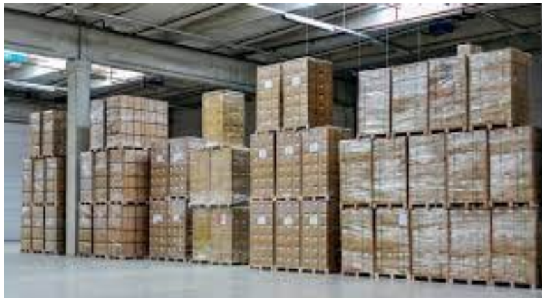
Figure 2: Block Stacking /Rajah 2: Penyusunan Blok