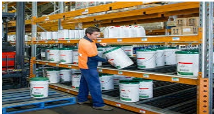
Figure 5: Live Storage /Rajah 5: Penyimpanan Secara Langsung